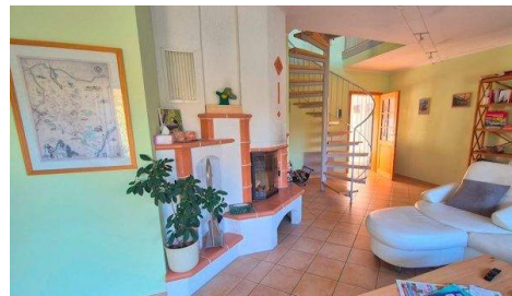
Wohnen 3 mit Kamin.jpg