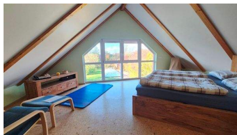
Schafen mit Fenster.jpg