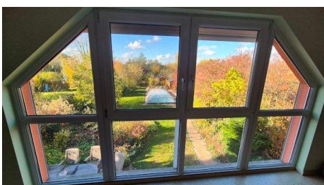
Schlafen Ausblick ins Grüne.jpg