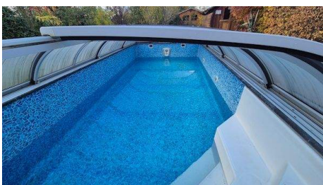
Pool mit Gegenstromanlage.jpg