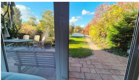
Wohnen Ausgang Terrasse.jpg